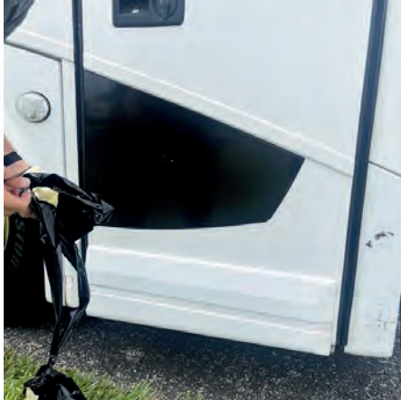
Figure 7 : Bords découpés/collés en vinyle