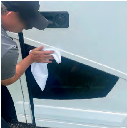
Figure 1 : Nettoyage de la vitre inférieure

1. Nettoyer la vitre inférieure de la porte d'entrée à l'aide d'alcool isopropylique et d'un chiffon en microfibre (Figure 1) et préparer le vinyle noir fourni de 23,5 po x 35,5 po (Figure 2).