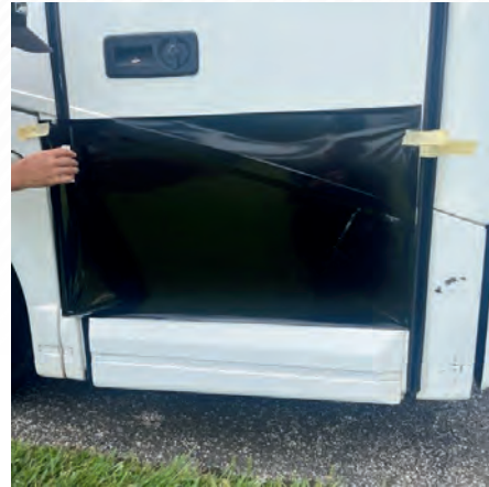
Figure 4 : Emplacement du vinyle/de la garniture collés

5. À l'aide d'une raclette, travail depuis de haut en bas et de gauche à droite , en veillant à ce que toutes les bulles ne soient plus présentes (Figure 5).