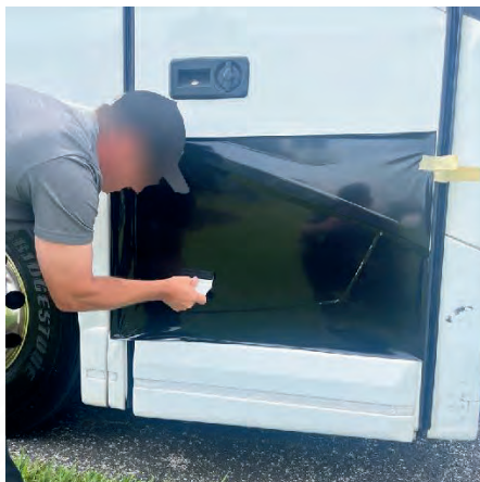
Figure 5 : Élimination des bulles

7. À l'aide d'une lame de rasoir, tailler soigneusement les bords du vinyle noir le long de la couture Sikaflex.