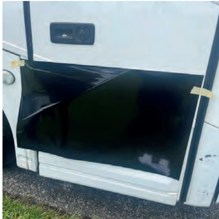
Figure 3 : Mise en scène du vinyle

4. À l'aide d'une raclette, commencer à adhérer le vinyle jusqu'au car. Commencez par la moulure au-dessus de la fenêtre. (Figure 4).