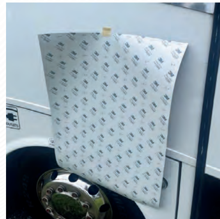
Figure 2 : Vinyle noir